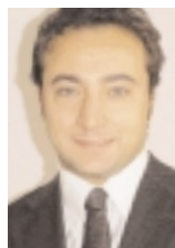
By Alessandro Bedeschi, FENA European Affairs Adviser in Brussels

Positive Report on the Small Business Act (SBA) adopted by the European Parliament