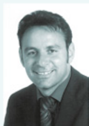
S. Chaar Geschäftsführer

Wir unterstützen Sie und Ihre Fachverkäufer durch professionelle Organisation sowie einen Moderator, der die Veranstaltung kompetent begleitet und verstärkt.