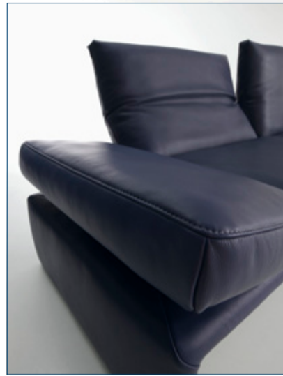
„Raoul“ – vereint Ästhetik und Funktion. „Raoul“ – combines aesthetics and function.

Traditional house fair in upper Franconia – the Company of the Month for April in the “Yes to Germany” initiative invited retailers and representatives of the media to its own showroom to be won over by the innovative upholstered furniture, first-class tables and chairs, and the high quality accessories. The space of about 3.000 sqm, which has been partly remodelled