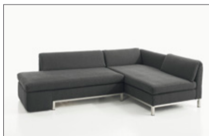
„Rotario“ – raffinierte Einsatzmöglichkeiten. „Rotario“ – ingenious possibilities.

and has a specially designed new exhibition area, was a perfect setting for the designer pieces. “We are satisfied with this year’s house fair. Although some of the retailers didn’t show up, probably due to the large number of events in the past months, we were able to intensify the dialogues with our customers and develop new ideas from those impulses. We are very happy about