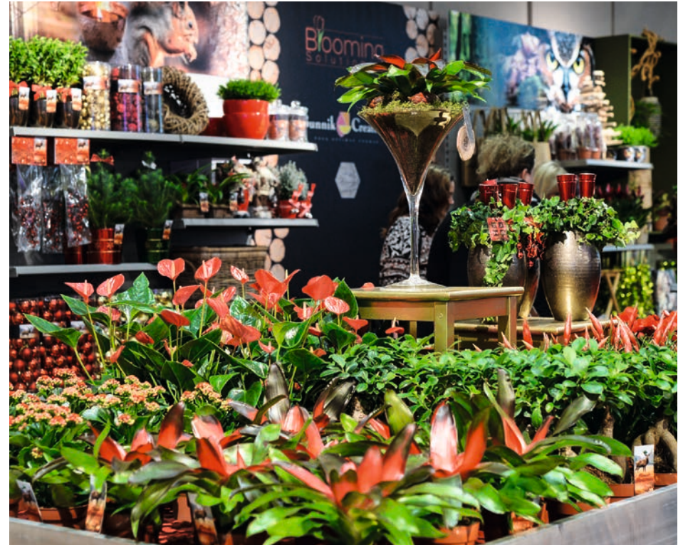
„Floradecora“ – so heißt die neue Orderplattform für Frischblumen und Zierpflanzen, die parallel zur Christmasworld stattfindet.

Die dazu passende „Hardware“ wie Vasen, Blumentöpfe, sonstige Dekoration und Accessoires bietet die Christmasworld in reicher Auswahl. So offeriert das kombinierte Messeangebot „Frischblumen + Deko“ den Besuchern neue Möglichkeiten, die Kunden im Laden zu begeistern und neue Kunden zu gewinnen.