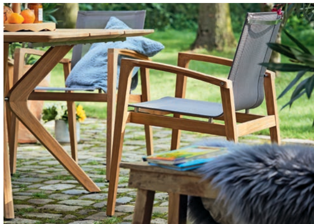
Starkes Duo: Teakholz in perfekter Kombination mit Sitz- und Rückenflächen aus Textilene.