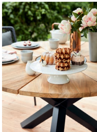
Tischplatte aus recyceltem Teak, einem „Holz mit Geschichte“.