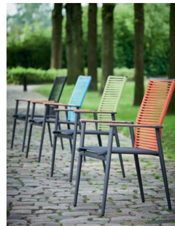
Charakteristisch: Das frische und gleichzeitig zeitlos schöne Design.